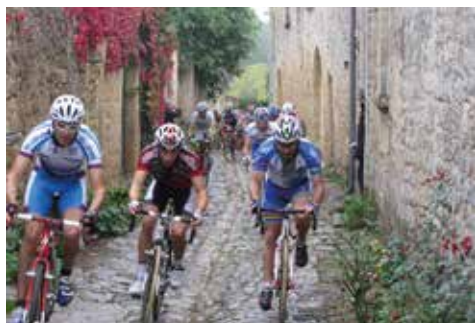
Cyclo cross dans les rues de Saint Macaire (33) ©Jean-Marie Bila.

Jean-Marie BILA, architecte, ancien Maire de Saint Macaire (33).