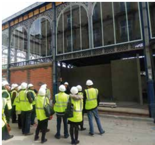
Visite de la rénovation de la Halle de Limoges réalisée par l'architecte Hélène Popéa.