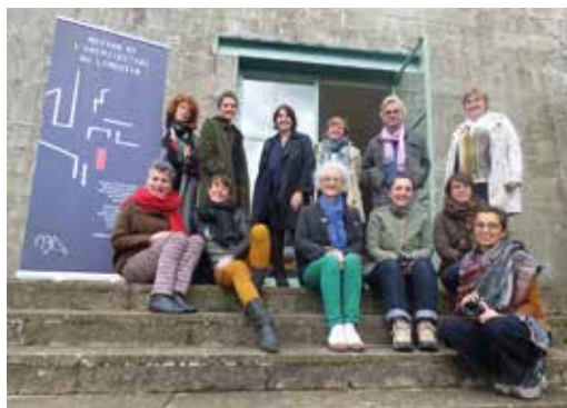
Maison de l'architecture du Limousin en Nouvelle-Aquitaine FORMATION - transmettre l'architecture - au CIAP de Vassivière.